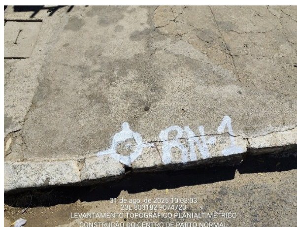
Foto 04 - Locação das cotas de níveis