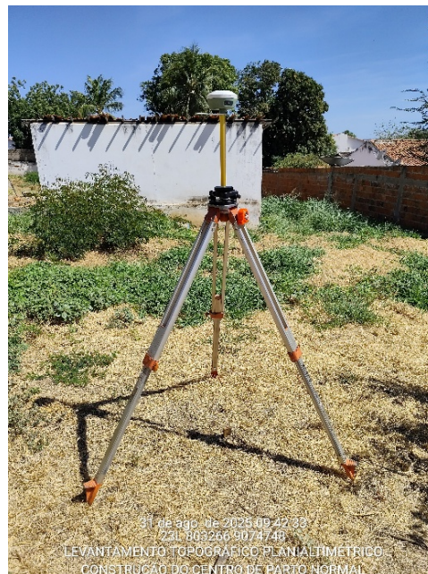
Foto 02 - Locação das cotas de níveis