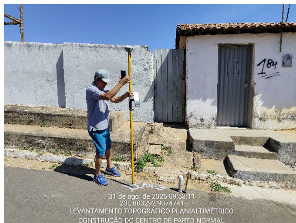
Foto 03 - Locação das cotas de níveis