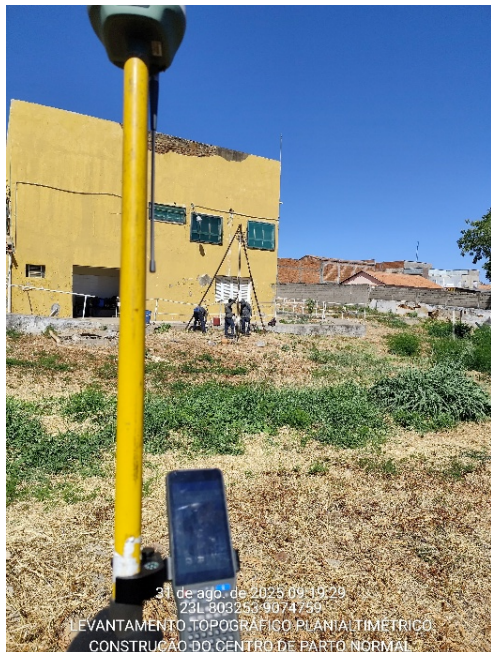
Foto 01 - Locação da área interna